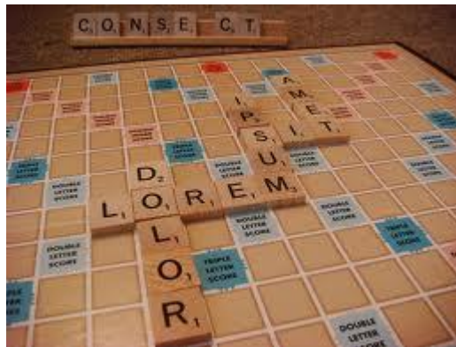
3. ácras: Sed aliquet risus a tortor (URL2)

Vestibulum ante ipsum primis in faucibus orci luctus et ultrices posuere cubilia Curae; Morbi lacinia molestie dui. Praesent blandit dolor. Sed non quam. In vel mi sit amet augue congue elementum. Morbi in ipsum sit amet pede facilisis laoreet. Donec lacus nunc, viverra nec, blandit vel, egestas et, augue. Vestibulum tincidunt malesuada tellus. Ut ultrices ultrices enim. Curabitur sit amet mauris. Morbi in dui quis est pulvinar ullamcorper. Nulla facilisi. Integer lacinia sollicitudin massa.