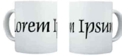
2. ácras: Maecenas mattis (DUIS – TELLUS 2007)

conubia nostra, per inceptos himenaeos. Curabitur sodales ligula in libero. Sed dignissim lacinia nunc. Curabitur tortor. Pellentesque nibh. Aenean quam (DNEC 2011).