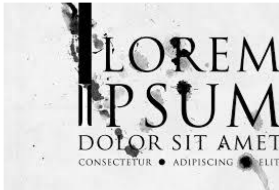
4. ácras: Sed non quam (URL1)

Nunc feugiat mi a tellus consequat imperdiet. Vestibulum sapien. Proin quam. Etiam ultrices. Suspendisse in justo eu magna luctus suscipit. Sed lectus. Integer euismod lacus luctus magna. Quisque cursus, metus vitae pharetra auctor, sem massa mattis sem, at interdum magna augue eget diam. Vestibulum ante ipsum primis in faucibus orci luctus et ultrices posuere cubilia Curae; Morbi lacinia molestie dui. Praesent blandit dolor.